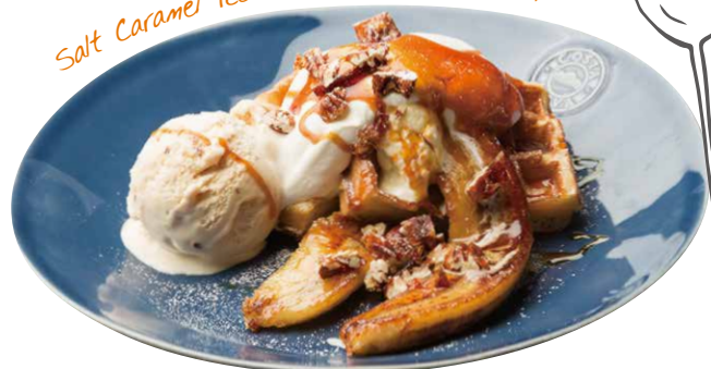
Salt Caramel Ice Cream & Butter Cream