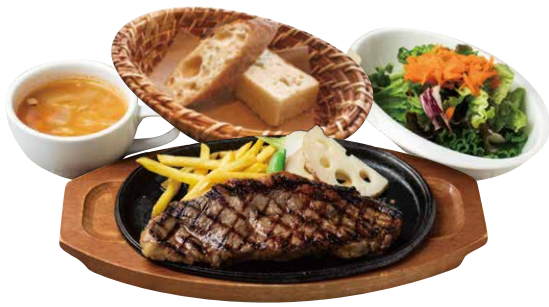
ステーキランチ 200g / 1750 Steak Lunch 300g / 2400 US産サーロインステーキ+スープ+サラダ+パンorライス