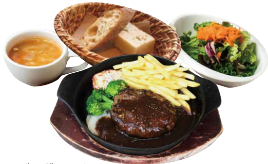
ハンバーグランチ 180g / 1200 Hamburger Steak Lunch 270g / 1500 ハンバーグ+スープ+サラダ+パンorライス