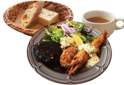
大人の洋食プレートランチ 1600 YOUSYOKU-Plate Lunch ハンバーグ+オムライス+エビフライ+コロケ+スープ+パンorライス