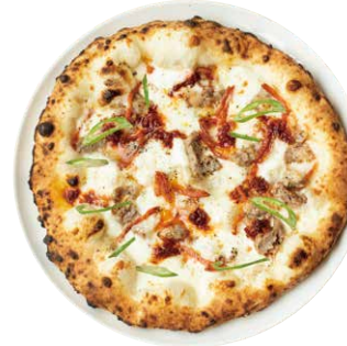
青唐辛子の 辛いピッツァ