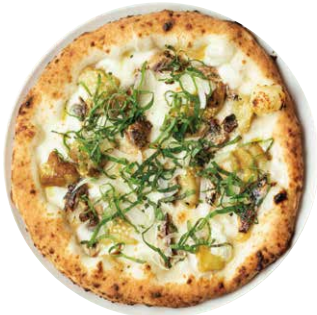
西京味噌と オイルサーディン