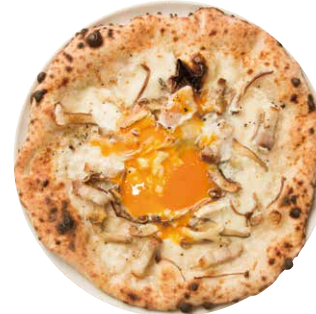
半熟卵と燻製チーズ