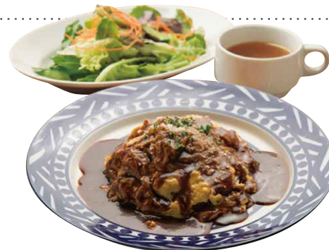
牛すじ煮込みのデミグラスソースのオムライス 1100 Omelette on the Rice オムライス+サラダ+スープ