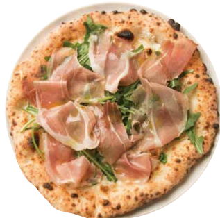
生ハムとルッコラ