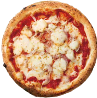
アンチョビと玉ねぎ