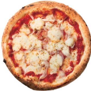
アンチョビと玉ねぎ