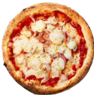
アンチョビと玉ねぎ