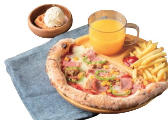
キッズピザランチ 850