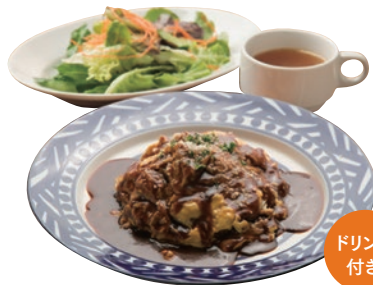
牛すじ煮込みの デミグラスソースオムライス 1400