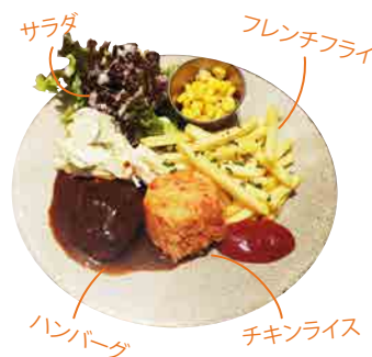
キッズプレートランチ 680