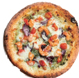
海老とトマト トレビスのジェノベーゼ