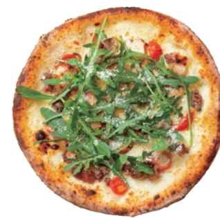
ごろごろお肉のピZZA