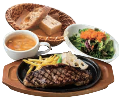
ステーキランチ 200g / 2050