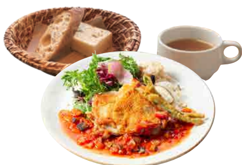
週替わりプレートランチ 1500