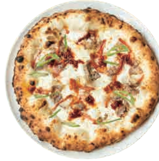
青唐辛子の 辛いピッツァ