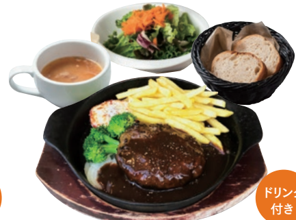
ハンバーグランチ 180g 1550