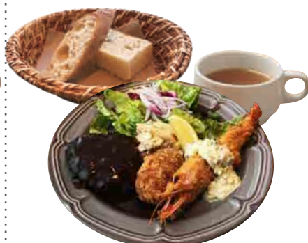
洋食プレートランチ 1900