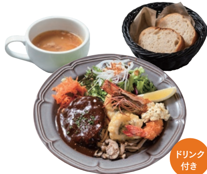
洋食プレートランチ 1850