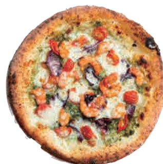
海老とトマト トレビスのジェノベーゼ