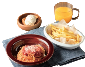
キッズパスタランチ 750