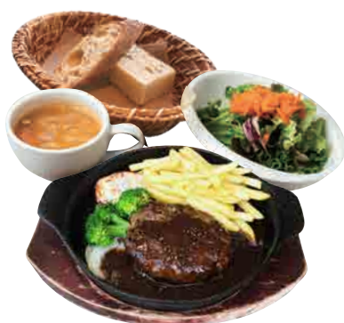
ハンバーグランチ 180g / 1500